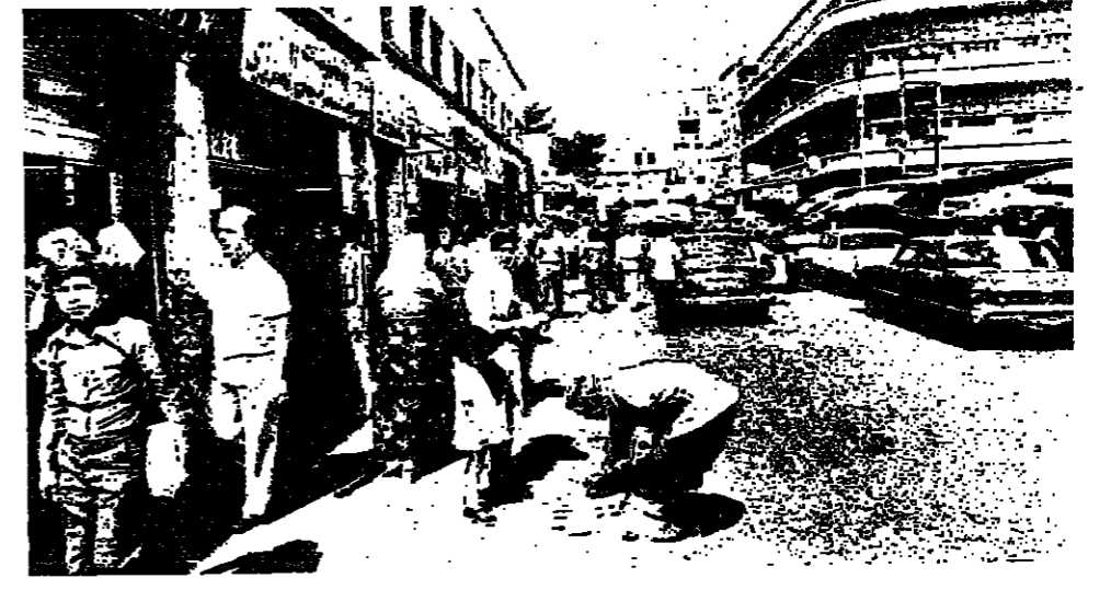
صيدا - من نزيه تقوزي: بدأت اسواق صيدا التجارية تشهد حركة نشيطة، بعد عودة الهدوء الى المنطقة، واستقرار الاوضاع.

استقبلت صيدا مع مطلع الاسبوع، السياح العرب من السعودية والكويت، وبعض دول الخليج العربي. وتسد شوارع العديد من السياح السعوديين والكويتيين بجوارهم في شوارع صيدا. وشهدت اسواق عاصمة الجنوب اقبالاً مبهراً عن غيرها من الاسواق، بعد جود استمر منذ مطلع شهر حزيران الماضي.